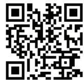
Фото-отчет о событии и ваши мелодии на Reactable здесь: