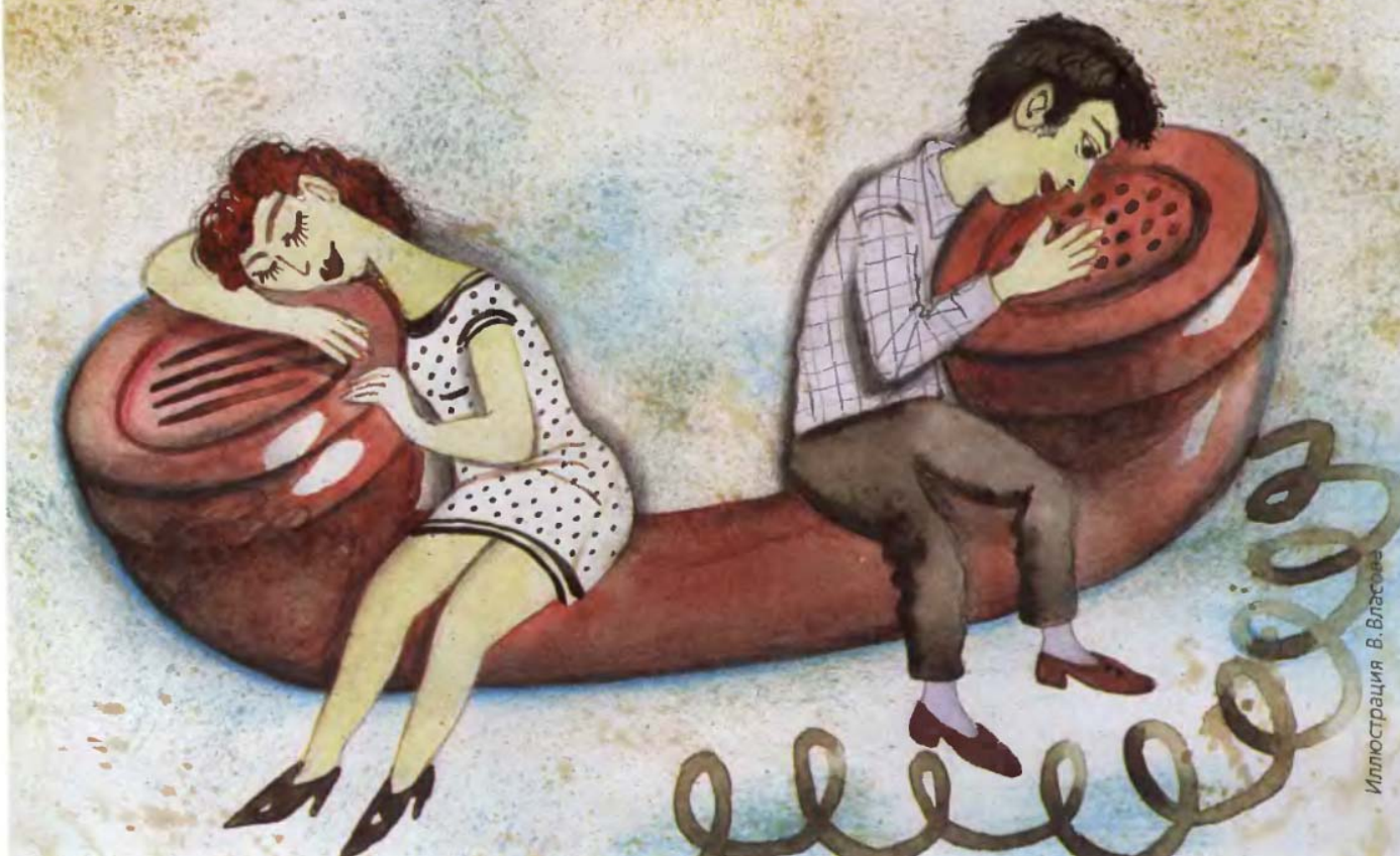
Иллюстрация В. Власова

Да, именно так выглядел первый транзистор, и неудивительно, что даже специалисты не сразу смогли разглядеть его триумфальное будущее. А между тем представленный прибор мог усиливать и генерировать электрические сигналы, а также выполнять функцию ключа, по команде открывающего или запирающего электрическую цепь. И, что принципиально важно, все это осуществлялось внутри твердого кристалла, а не в вакууме, как это происходит в электронной лампе. Отсюда