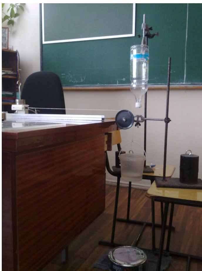
Фотография экспериментальной установки