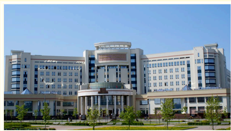
Здание 1-го учебного корпуса на новой территории МГУ имени М.В. Ломоносова (Ломоносовский пр-т, д. 27)

Секретариат Форума: тел: +7 (495) 629-94-23, E-mail: icse2011@yahoo.com