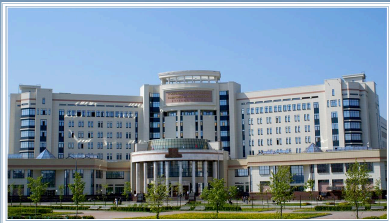
Здание 1-го учебного корпуса на новой территории МГУ им. М.В. Ломоносова (Ломоносовский пр-т, д. 27)

Секретариат Форума: тел: +7 (495) 629-94-23, E-mail: icce2011@yahoo.com